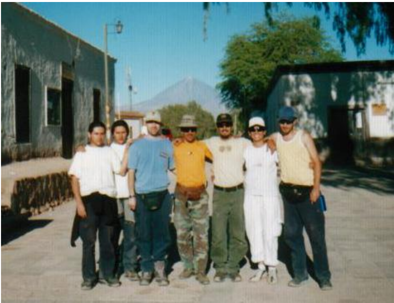
En la imagen: La expedición “en pleno” en San Pedro de Atacama.

Los incas, como es de suponer, conocieron perfectamente esta zona, particularmente el Licancabur, que según la creencia andina es el “Apu” —el espíritu de las montañas— más importante de toda esa región. Incluso los incas hacían peregrinaciones desde el Cusco para honrar al silencioso volcán. No en vano, su nombre significa “El Señor de las Alturas”.