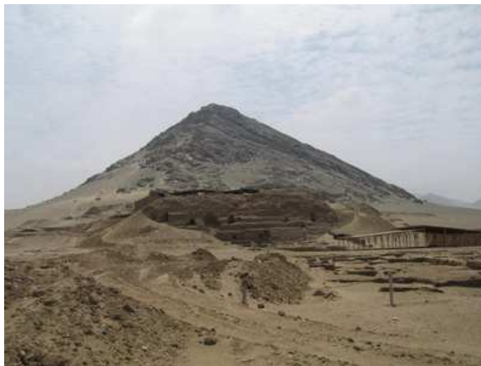
Cerro Blanco y Huaca de La Luna

En la experiencia, luego de las vocalizaciones respectivas, los hermanos veían imágenes que se sucedían una tras otra, visualizando una gran espiral que conectaba la tierra con el cielo y un gran torrente de energía que manaba desde el interior de la Tierra, en la llanura entre ambas Huacas, hacia arriba. Así mismo la presencia de gran cantidad de seres de blanco asistiendo y apoyando.