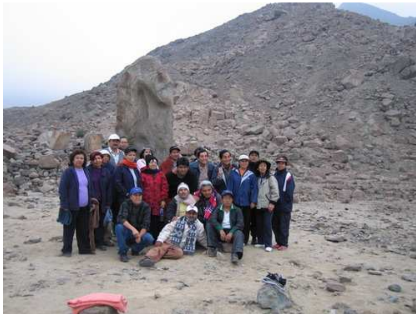
Fotografía al lado de uno de los menhires en Queneto

Después del trabajo y luego de tomarnos fotos nos dedicamos a explorar por la quebrada en la zona de petroglifos o grabados en piedra.