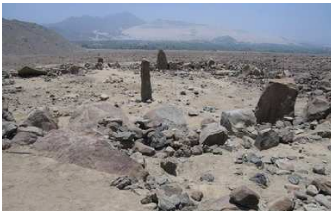
Queneto(Virú), lugar de menhires

A pocos kilómetros de la hacienda Tomabal, en el valle de Virú, departamento de La Libertad, cerca de los primeros contrafuertes de la cordillera Occidental de los Andes, existe una pequeña quebrada que lleva el nombre de Queneto, nominación que le viene del cerro de cuya sima arranca. A escasa distancia de las parcelas cultivadas del valle se hallan tres monolitos de piedra en hilera, llamados menhires, a más de diez metros los unos de los otros, los mismos que, por su tamaño y su forma, nos demuestran que han sido trasladados conscientemente y con determinado fin a ese paraje.