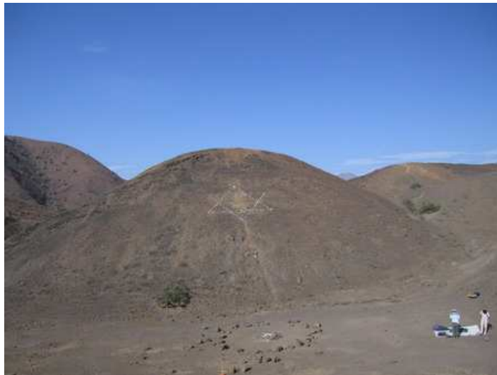
Collambay – Trujillo Lugar de campamentos

Llegó el 21 de Octubre y tal cual las comunicaciones salimos para Collambay, allí dialogamos y efectuamos nuestras prácticas acostumbradas de relajación, armonización, vocalizaciones con mantrams, cadena de irradiación planetaria, así como un ejercicio de energización de Chakras.