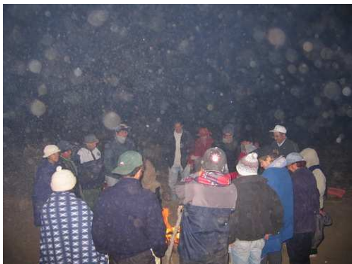
Alrededor del Fuego compartiendo canciones

Al día siguiente, nos levantamos a las 5 de la mañana, ya que las 6 AM estaba programado un trabajo de conexión y activación en la zona de los menhires con la Red de energía planetaria.