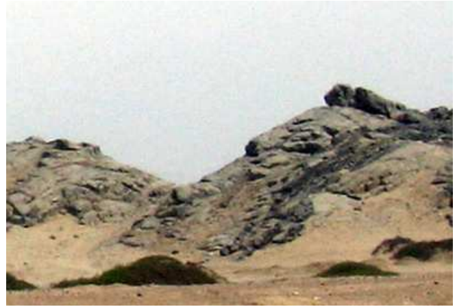
Cerro De Piedra al costado de Huacas del Sol y La Luna