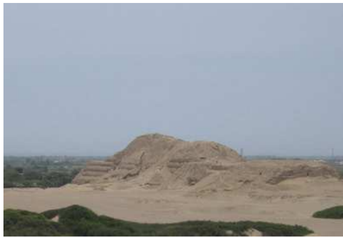
Huaca del Sol(Trujillo-Perú)

Primero ascendimos la pirámide del Sol y efectuamos un trabajo de reconexión con la Red Energética que existiría alrededor de nuestro Planeta, vocalizando una serie de mantrams como RAMA, AMAR, OM, ZIN-URU.