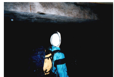
Uno de los claros dinteles de piedra en la Cueva de los Tayos