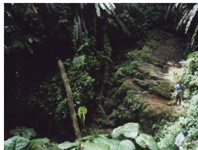
Cueva de acceso vertical al mundo subterráneo de los Tayos

sido visualizadas en nuestra experiencia de contacto, aquella biblioteca cósmica que los Guías extraterrestres denominaron “ El Libro de los de las Vestiduras Blancas ”.