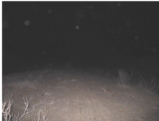
(Fotografías tomadas en la salida del 13 de Agosto 2005 – Trujillo- Collambay)

Lo curioso fue que cuando algunos de los niños veían las fotos en la cámara digital, decían que esas esferitas las venían observando desde hacía rato y hasta que casi las pisaban.