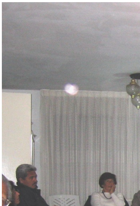
(Fotografía y ampliaciones tomada en la reunión del 12 de Agosto. Casa Alicia Paz)

Llegó así el Sábado 13 de Agosto, en que salimos nuevamente para la zona de Collambay, lugar que se venía convirtiendo en un recinto de positivismo y energía, favorable para nuestros trabajos, reflexiones y meditaciones, así como para el