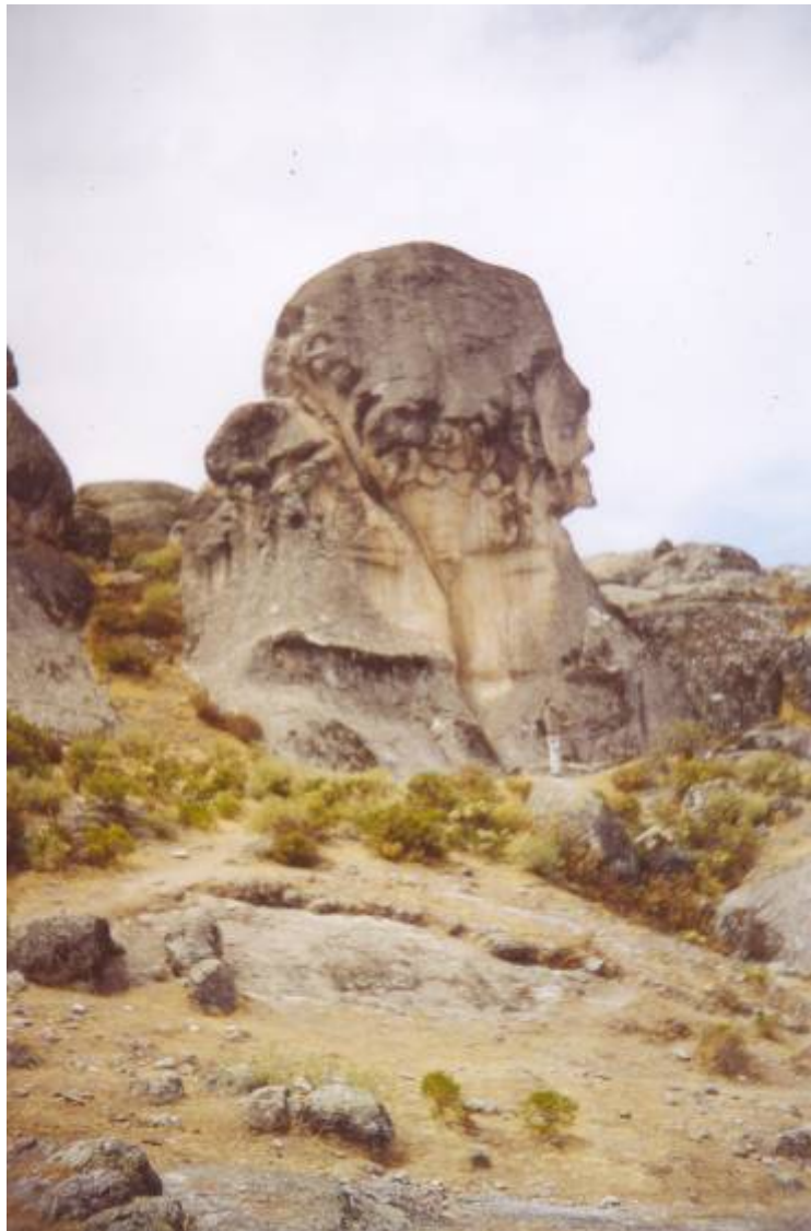
Misión Rahma Ayacucho tomada el 6 de septiembre