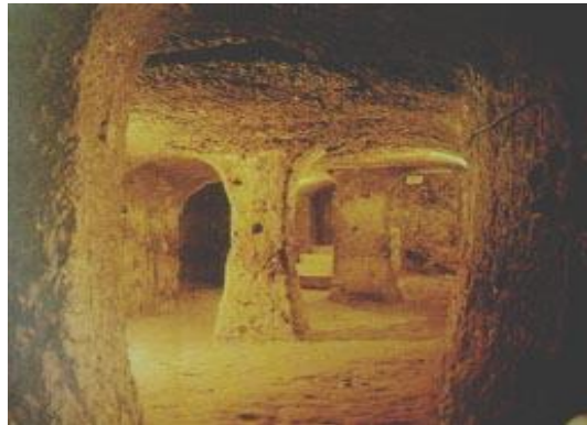
Subterráneos de Capadocia, Turquía

En la historia de diferentes pueblos de la Tierra encontramos claras referencias al mundo interior, un lugar secreto donde se reúnen los grandes sabios, los Rishis o Mahatmas , que sólo permiten el ingreso a su mundo a los que han sido llamados.