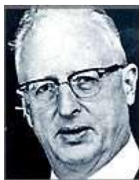
Donal Menzel, astrofísico y crítico acérrimo de los Ovnis. Tuvo una acreditación ultrasecreta y fue consejero de varios presidentes.