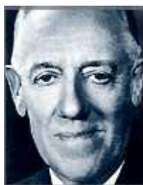
Detlev Bronk, biofísico. Director de la Academia Nacional de Ciencia y de la Junta Médica Consultiva del Comité de Energía Atómica.