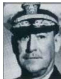
Contraalmirante Sidney Souers, primer director de la CIA (1946). Vicepresidente del Consejo de Seguridad Nacional en 1947.