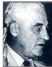
Nothan Twining, Jefe del Mando Logístico del Aire y, más tarde, presidente de la Junta de Jefes de Estado Mayor, el más alto cargo militar en EE UU.