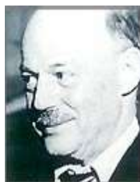
Jerome Hunsaker, renombrado diseñador de aviones y presidente del Comité Consultivo Nacional de Aeronáutica.