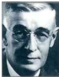
Vannevar Bush, presidente de la Junta de Investigación y Desarrollo. (1645 - 1949). Fue Consejero del presidente.