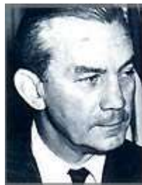
James Forrestal, primer ministro de Defensa de EEUU. En 1949 sufrió un colapso mental y se suicidó. Fue sustituido por Walter Bedell Smith.