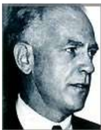
Gordon Gray, viceministro del Ejército. Fue consejero de Seguridad Nacional y director de la Junta de Estrategia Psicológica.