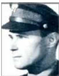
General Hoyt Vandenberg, jefe de información Militar durante la Segunda Guerra Mundial y segundo director de la CIA (1946 - 1947).