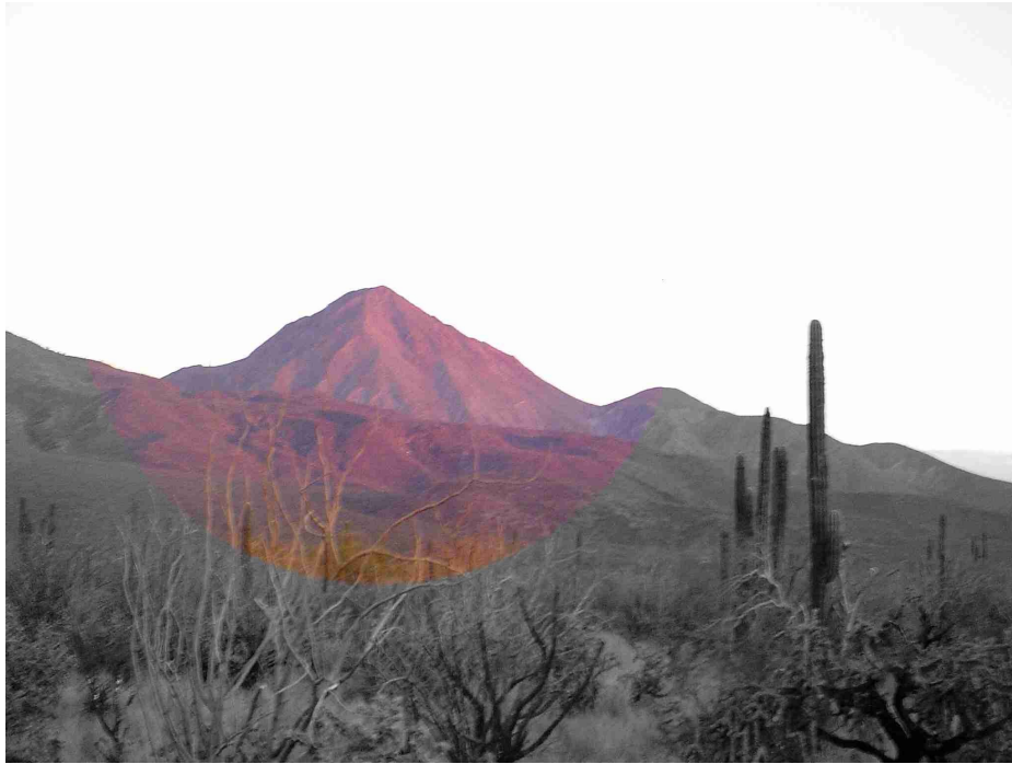
Rahma es Amar... Aquí, ahora y en cada instante del eterno presente...